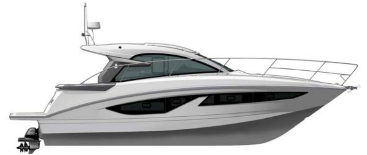
INBOARD VERSION VERSION INBOARD